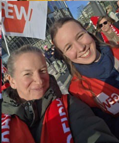
Eindrücke von den Streiktagen 22.1., 28.1., 29.1. und 10.2.2026